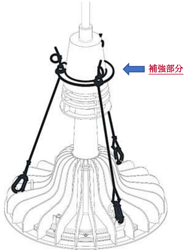
《ソケットタイプ対策》